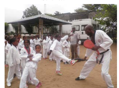
Tae Kwon Do: Sport in der Schule