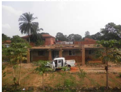
Konvent (Studentenheim von Hikaf)