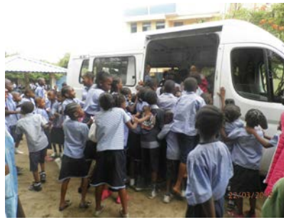
Schulbus Mater Vitae