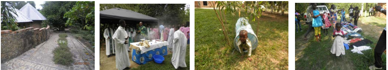
Garten Mater Vitae