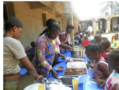
Mahlzeit am Konvent